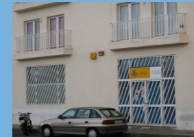
Oficina de Arrecife