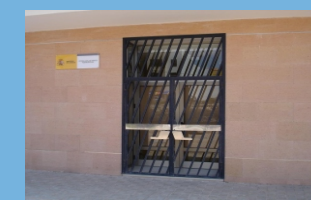
Oficina de Puerto del Rosario