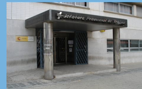
Oficina de Las Palmas de Gran Canaria